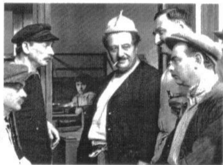
Graphisme: Brigitte Archambault